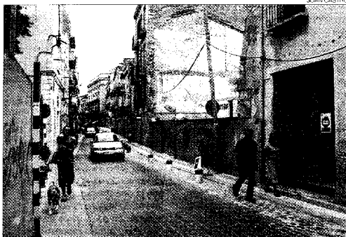
▶ La calle de la Jonquera de Figueres será una de las reasfaltadas.

Además de mejorar la imagen del casco antiguo, también se construirá un centro cívico y una biblioteca en un nuevo edificio de 3.000 metros cuadrados de la calle de Rec Ar-