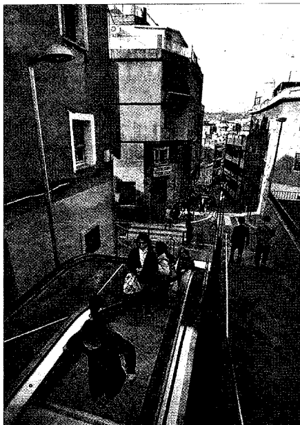
Escaleras mecánicas entre Mas Mari y Pirineos.