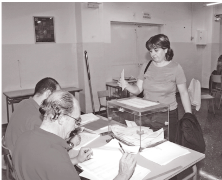
Los 24 colegios electorales de la ciudad abrirán sus puertas a las nueve de la mañana del próximo domingo.

El Congreso es la Cámara Baja de las Cortes Generales. Está compuesto por 350 diputados que