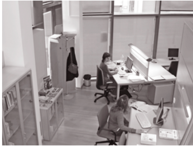
El nou Centre d'Informació i Recursos per a Dones (CIRD).