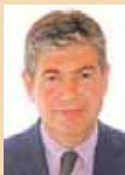
Bartomeu Muñoz i Calvet. Alcalde de Santa Coloma de Gramenet.

El desarrollo de las nuevas tecnologías de la información y de la comunicación hace posible el progreso y transformación de las relaciones entre las administraciones y los ciudadanos. Internet y el resto de plataformas y recursos digitales se han consolidado como instrumentos esenciales de información, comunicación y expresión. El portal web de nuestro Ayuntamiento ha experimentado en los últimos meses una evolución significativa tanto en su diseño como en sus contenidos. Con la intención de convertirlo en uno de los medios más eficaces de comunicación entre los colomenses y su ciudad, ampliamos día a día sus recursos y contenidos. La aplicación de dispositivos para una correcta accesibilidad de personas con déficits visuales o la disponibilidad de un buen número de trámites administrativos en línea son algunos de estos recursos; mientras que la información puntual de lo más importante de los servicios y de la actividad municipal pretende que los contenidos sean útiles para el conjunto de los visitantes de la web. Estamos trabajando para seguir dando nuevas prestaciones y por lo más amplia implantación de las nuevas tecnologías en nuestra ciudad.