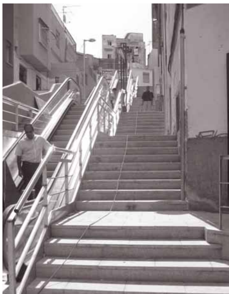
Imatge, dies abans del final de les obres, de les escales mecàniques i de obra de la carrer del Bruc.

L a posada en marxa el dimecres dia 12 de setembre (19 hores) de les dos escales mecàniques instal·lades en el tram final de la carrer del Bruc, per a fer més còmode el pas dels peatons en l'espai amb un desnivell de nou metres que hi ha entre les carreres de Mas Marí i Sant Pasqual, és la primera de les diverses actuacions que contempla el projecte Eix Bruc. Se tracta d'un conjunt d'obres enmarcades en el procés d'intervenció integral de reforma que se està llevant a cobert en els setze barris de la Serra d'en Mena, que comparteixen Santa Coloma i Badalona, amb l'ajuda econòmica de la llei de Barris de la Generalitat, i que inclou altres actuacions de gran importància que possibilitaran la millora dels barris del Fondo, Santa Rosa, Raval i Salfareigs. La instal·lació de les escales me-