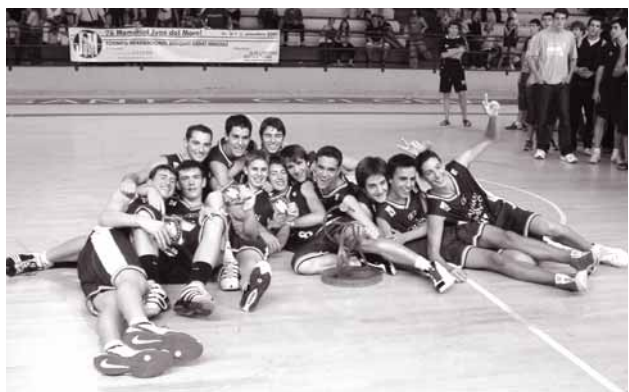
El Caja San Fernando de Sevilla, després de proclamar-se campió en l'edició de l'any passat.

La associació Saucha ha obert dos grups de yoga en el Centre Cívic del Raval (Monturiol, 20). Les classes començaran el dia 17 i se impartiran los lunes de 17.30 a 19.15 y de 19.30 a 21.15 h. Més informació, en el tel. 93 313 12 10.