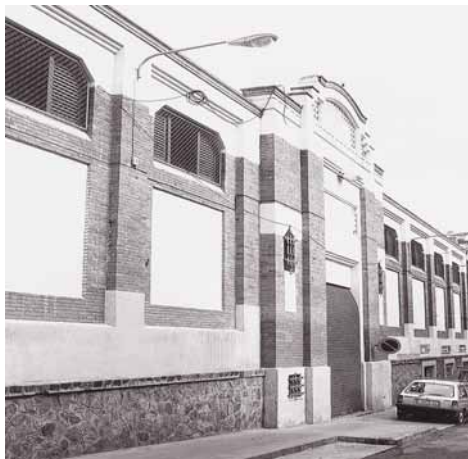
La reforma del mercat Sagarra és una de les actuacions previstes.

El Projecte preveu un total de 25 actuacions als barris centrals (Llatí, Can Mariner, Centre, Cementiri Vell, Riera Alta, Singuerlín, Riu Nord i Riu Sud) tendents a enfortir la cohesió econòmica, social i territorial dels barris colomencs. Una de les accions més importants és la despesa de 4,72 milions d'euros en la rehabilitació dels edificis d'habitatge. L'Ajuntament continuarà així amb la política d'ajudes a la rehabilitació i a la