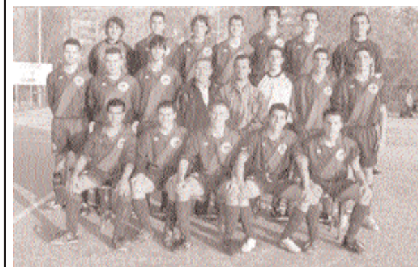
Éxitos de las categorías inferiores del CD Arrabal. Los equipos Infantil y juvenil del CD Arrabal se han proclamado campeones de liga y han ascendido a la Primera División de sus respectivas categorías.