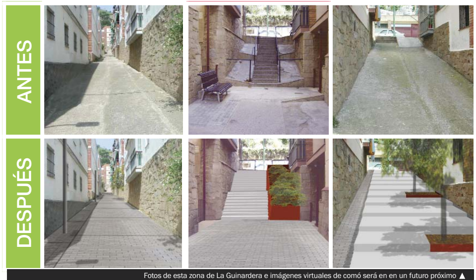
Fotos de esta zona de La Guinardera e imágenes virtuales de cómo será en un futuro próximo ▶