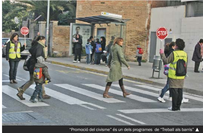
"Promoció del civisme" és un dels programes de "Treball als barris" ▲

► L'Ajuntament, a través de l'empresa municipal Grameimpuls, ha posat en marxa una nova convocatòria de "Treball als barris". Es tracta d'un conjunt de programes de formació i ocupació laboral destinat a la millora social, econòmica i urbana dels barris de la serra d'en Mena (el Fondo, Santa Rosa, el Raval i els Safarejots) i dels barris centrals (el Centre, Cementiri Vell, el Llatí, la Riera Alta, el Riu Nord, el Riu Sud i