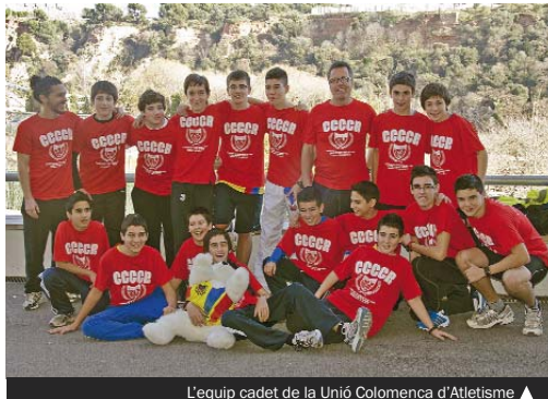
L'equip cadet de la Unió Colomenca d'Atletisme ▲

L'equip colomenc ja havia obtingut un premi al seu treball en classificar-se, per primera vegada en la història de l'atletisme a Santa Coloma, per a aquest Campionat. No obstant això, el dia de la prova